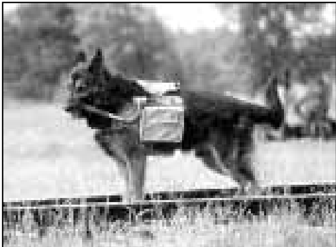
Эта собака на самом деле не собирается взрывать рельсы, на которых стоит: она участвует в показательных выступлениях в школе служебного собаководства в Дмитровском районе Подмосковья. И все же по ее облику можно судить о том, как выглядели реальные «боевые» собаки, использовавшиеся для подрыва железнодорожного полотна. Дергая зубами за шнур, они сбрасывали «седло», начиненное взрывчаткой, в заданном месте. Снимок сделан в 1990 г.

Обстановка в школах служебного собаководства хорошо отражала процессы, происходившие в стране. Нэп наполнил