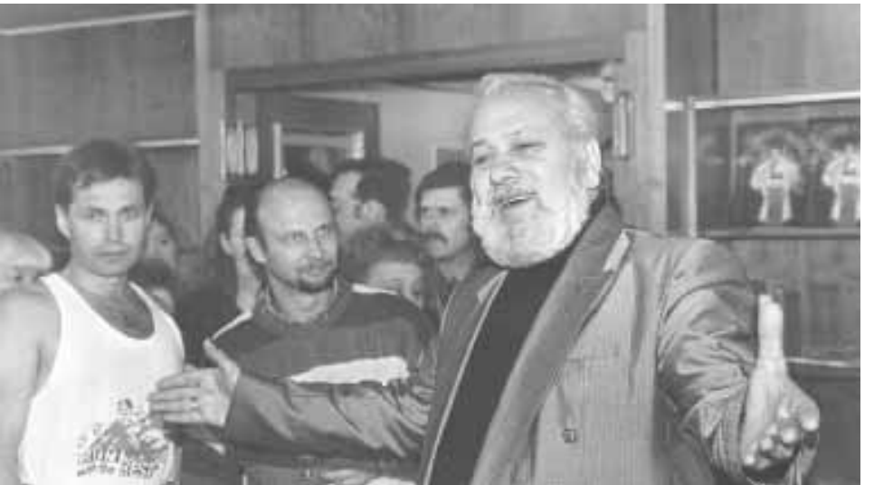
А это Киркоров-старший.