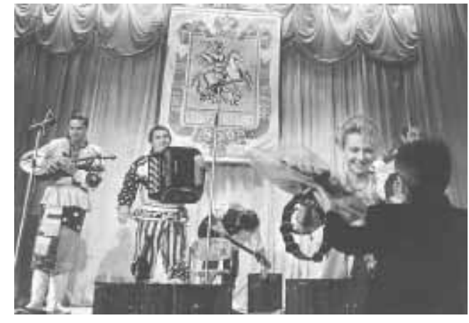
Концерт в Костроме