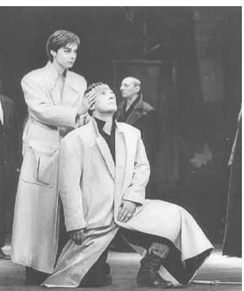
Редко, когда увидишь погрязшую в убийствах чету Макбетов, которая вызвала бы жалость. Но именно жалость испытываешь, глядя, как эта симпатичная молодая пара, соблазненная и отравленная духом времени, падает в грех дедовщины раньше, чем способна по-настоящему осмыслить этот мир. И в результате, измучив и расстрыв свои любви, которую они еще не научились ценить, они распадаются и гибнут по одиночке, позавав друг друга.

Москва пронесла любовь к Тбилисскому театру им. Руставели через годы, распад Союза, войны и прочие катаклизмы. Рвущиеся на спектакль студенты, мающиеся в поисках места коллеги, море цветов — словом, все атрибуты живейшего интереса присутствовали на единственном показе «Макбета» в постановке Роберта Стурца на II Чеховском фестивале.