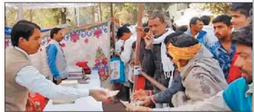
स्टालों पर धार्मिक पुस्तकें खरीदने वालों की भी भीड़ देखी गई।