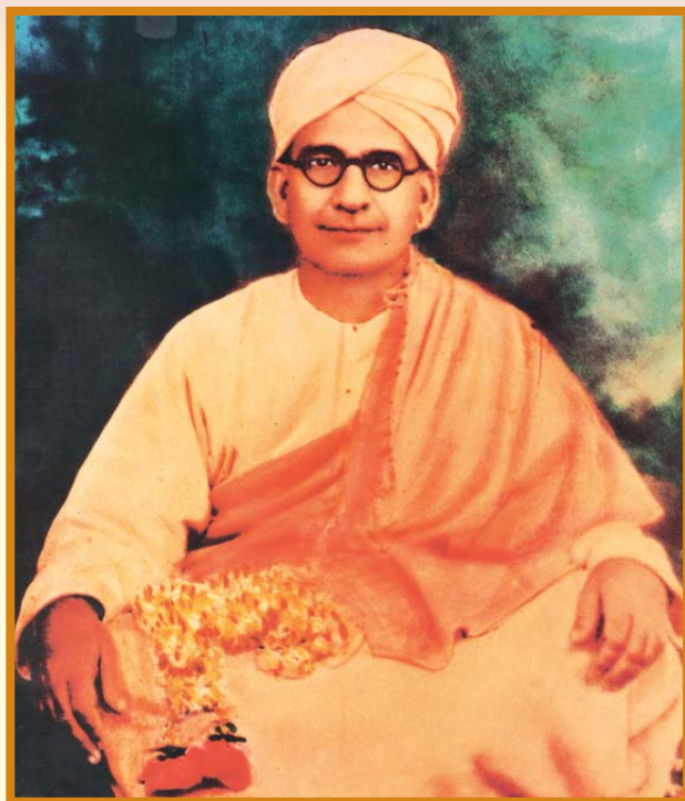
चैत्र पूर्णिमा 1868 (19 अप्रैल)

भ्रम भूल में भटकते, मिला अचानक गुरु मुझे,