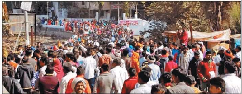
झाबुआ स्थित श्रीरामशरणम भवन पर रविवार को राम नाम की दीक्षा के लिए उमड़ी भक्तों की भीड़।