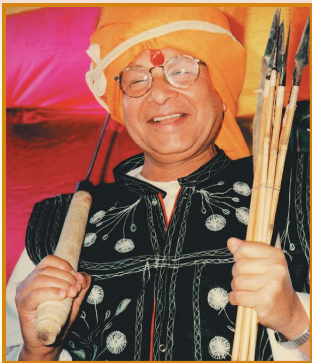
15 मार्च, 1940