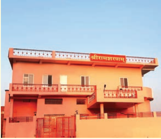
श्रीरामशरणम्, अमरपाटन् भवन