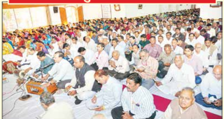
श्रीरामशरणम माधव सत्संग आश्रम में आयोजित सत्संग में प्रवचन सुनते भक्त।