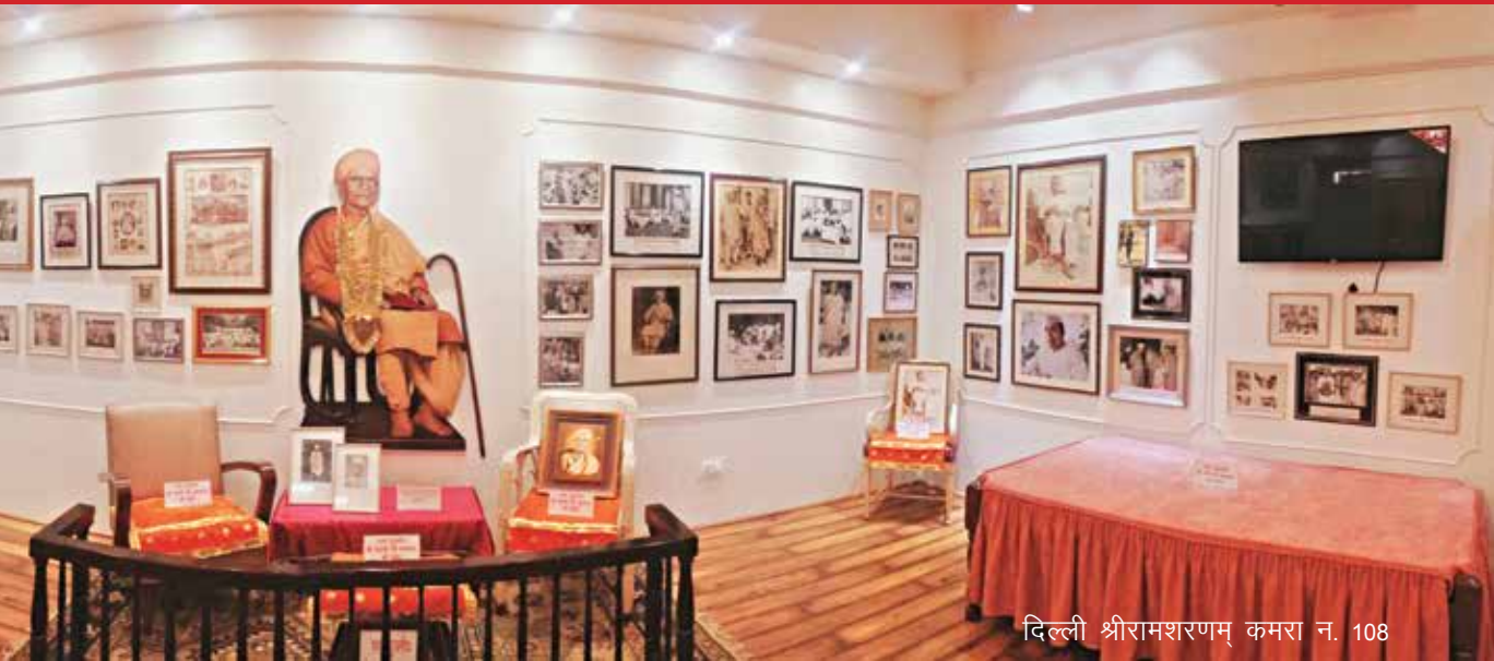
दिल्ली श्रीरामशरणम् कमरा न. 108