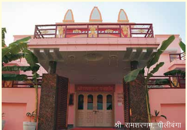
श्री रामशरणम्, पीलीबंगा

श्रीरामशरणम् दिल्ली, कमरा न. 108 में तीनों गुरुजनों की तस्वीरें एवं उनके द्वारा प्रयोग की गई वस्तुएँ रखी गई हैं। इस कमरे को प्रत्येक रविवार सत्संग के पश्चात् आधे घण्टे के लिए खोला जाता है। ■