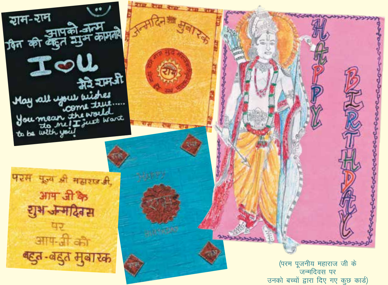
(परम पूजनीय महाराज जी के जन्मदिवस पर उनको बच्चों द्वारा दिए गए कुछ कार्ड)