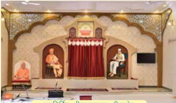
नवनिर्मित श्रीरामशरणम्, बीकानेर