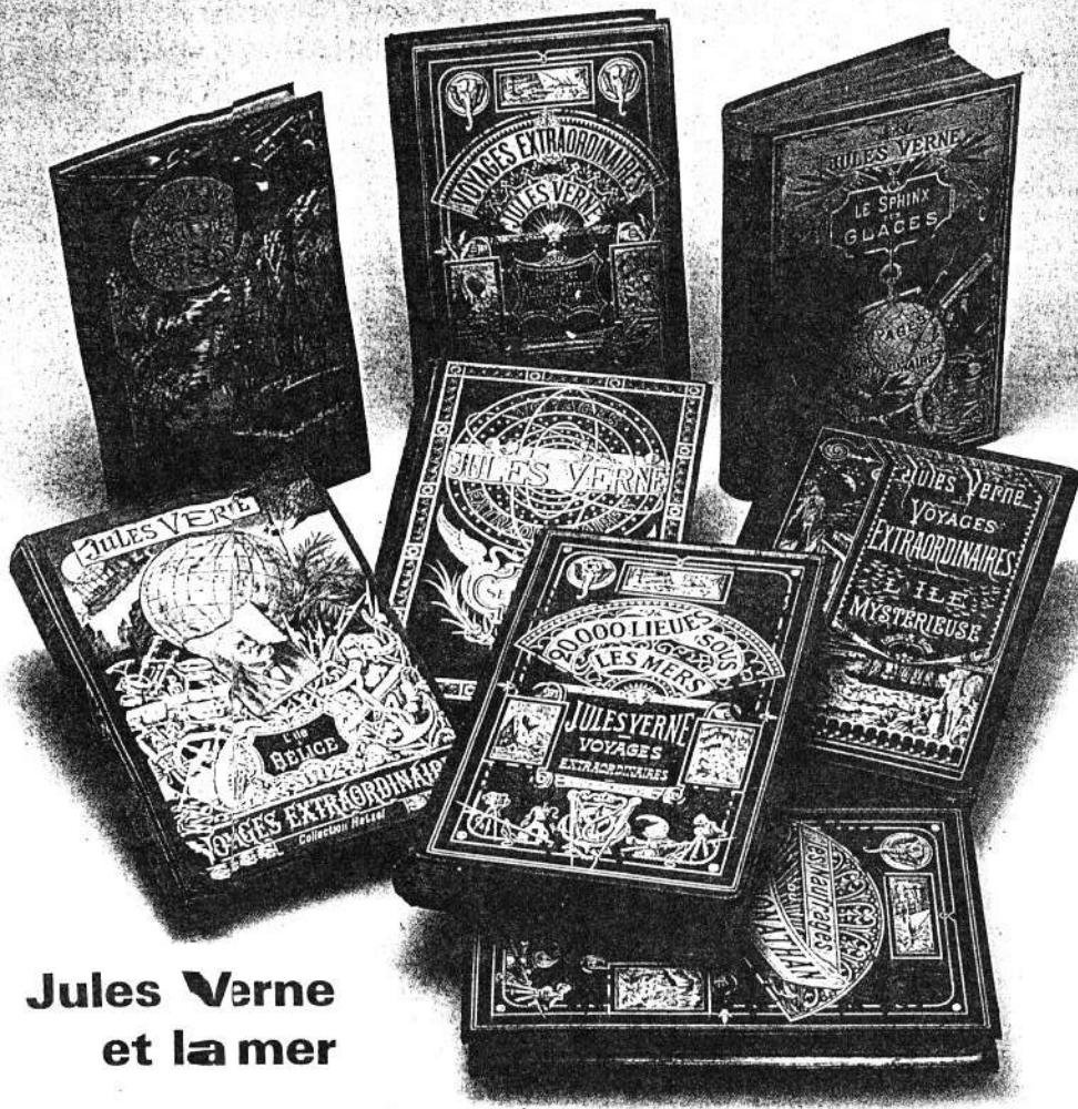
Jules Verne et la mer

L'immensité océanique offre à l'homme toutes les possibilités d'évasion. Créatures mythiques surgies du fond des âges, phénomènes naturels amplifiés, éléments interférant les uns sur les autres ne sont, tout compte fait, que la manifestation des multiples facettes de ce qui est, pour le romancier, un espace de liberté.