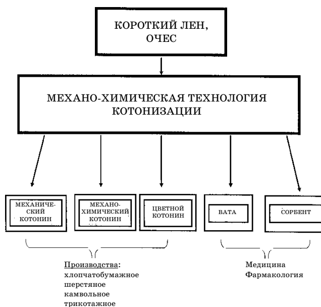
Рис. 1. Области применения механо-химического котонина

В 1997 году работа продолжалась в направлении повышения универсальности и гибкости технологии. На рис. 1 показано, что в зависимости от качества исходного сырья и его целевого назначения новая технология дает возможность получать